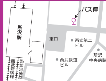
所沢駅スクールバス停