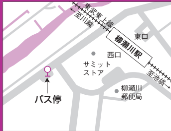
柳瀬川駅スクールバス停