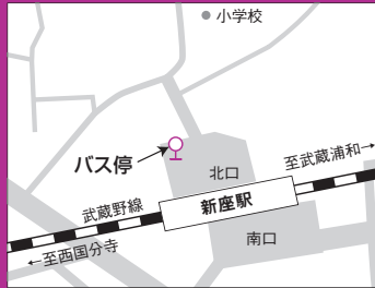
新座駅スクールバス停