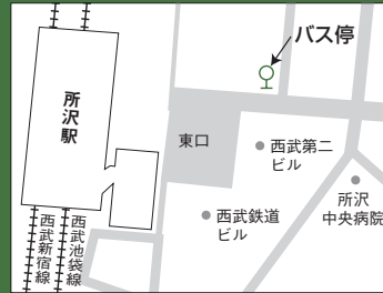
所沢駅スクールバス停