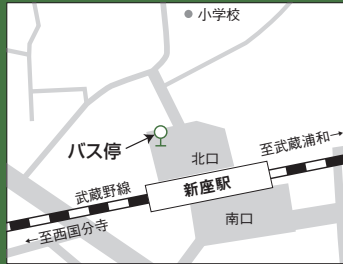
新座駅スクールバス停