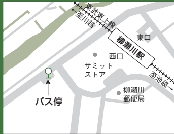
柳瀬川駅スクールバス停