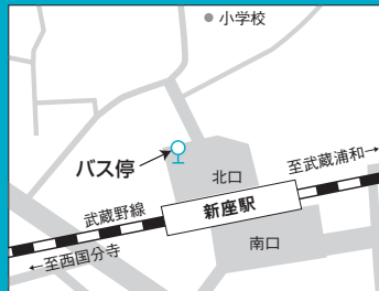
新座駅スクールバス停