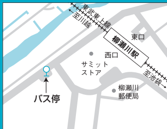
柳瀬川駅スクールバス停