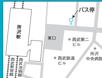
所沢駅スクールバス停