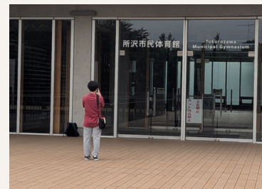
▲早朝1番で会場に並ぶ「5人目の選手」