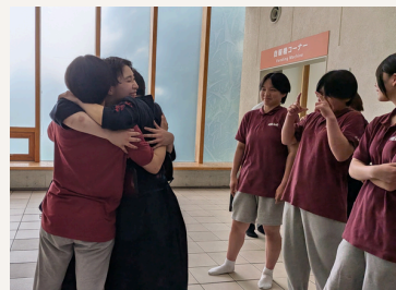
▲勝利を分かち合う三女達